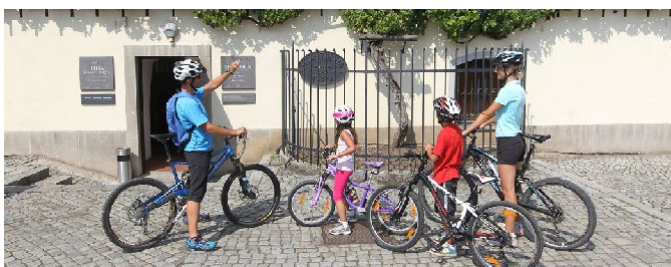
Cyklisté před nejstarší vinicí v Mariboru, Slovinsko [14].