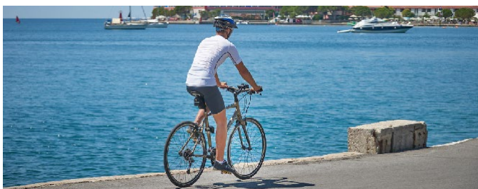
Cyklista na pobřeží Slovinska [15].