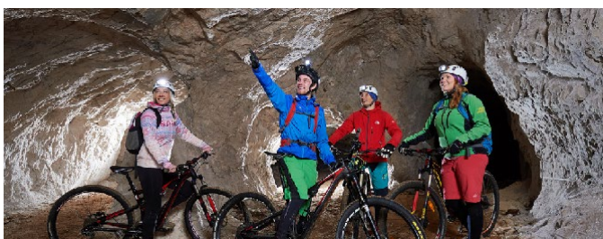
Podzemní cyklistika v hoře Peca, Slovinsko [16].